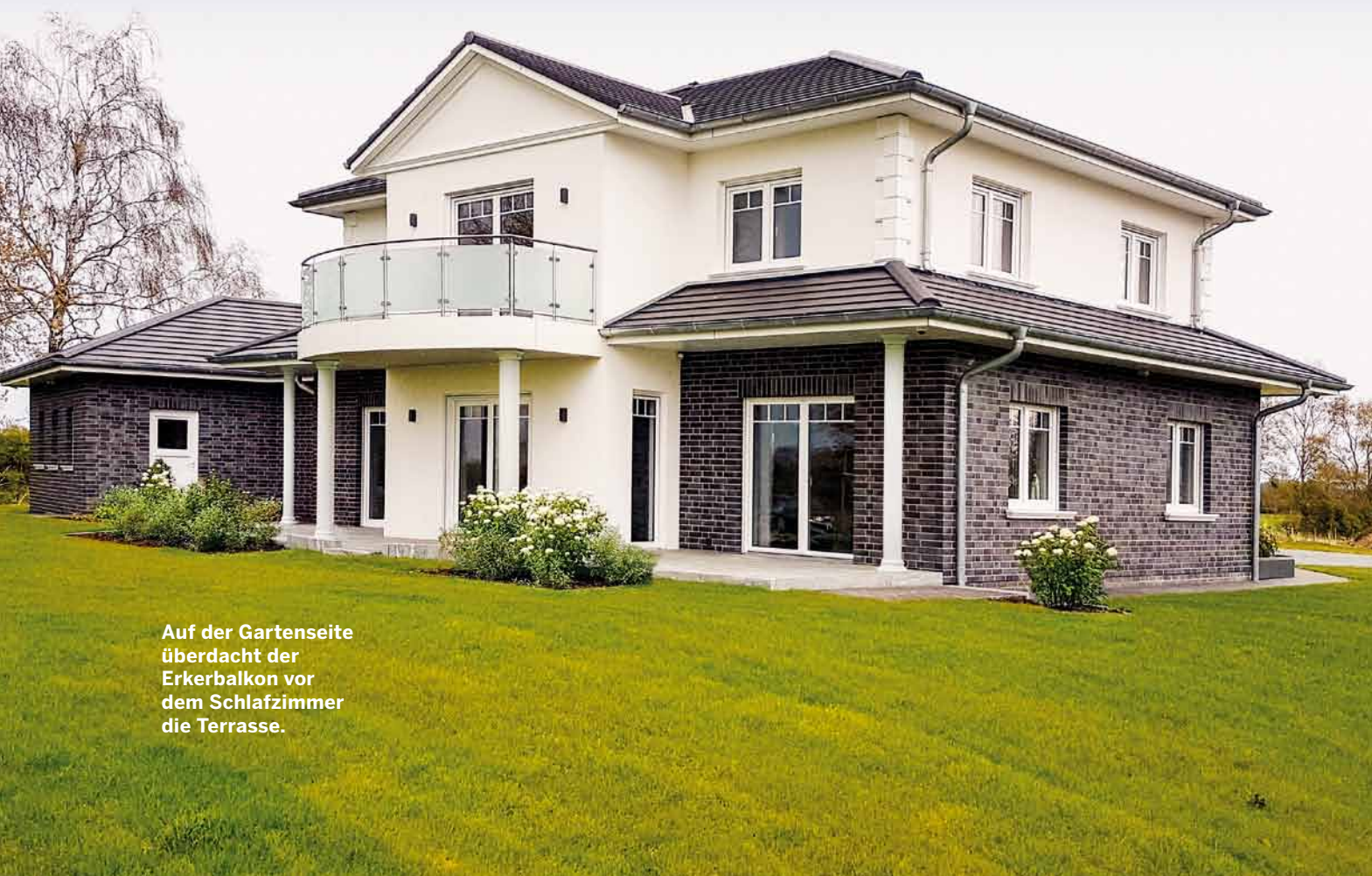
Auf der Gartenseite überdacht der Erkerbalkon vor dem Schlafzimmer die Terrasse.