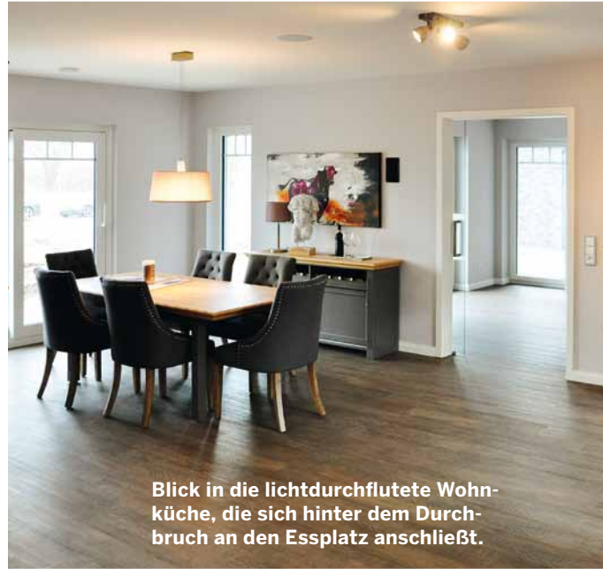
Blick in die lichtdurchflutete Wohnküche, die sich hinter dem Durchbruch an den Essplatz anschließt.

Kein Wunder, dass dieses Haus 2017 den Deutschen Musterhauspreis als beliebteste Stadtvilla gewonnen hat: Es lässt ganz einfach keine Wünsche offen